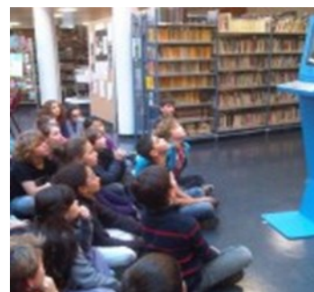
Borne CDI avec vidéos sur l'environnement